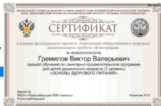
Рис. 15. – Просмотр результатов итогового тестирования и получение сертификата, подтверждающего успешность прохождения обучения

В случае если набрано менее 80% правильных ответов, Программа указывает проблемные разделы и предлагает пройти тестирование повторно. Количество повторных тестирований не ограничено по количеству, но ограничено по времени. Повторное тестирование можно пройти не ранее чем через 24 часа от предыдущего тестирования.